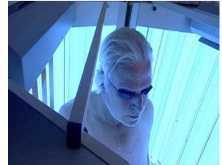
Gentle light medicine using DermalGlas Acryl

Alleine die Funktion des selektiven Abfilterns schädlicher Strahlungsanteile eröffnet neue Einsatzmöglichkeiten der Sonne als anerkannt ältestes Heilmittel und führt zu Qualitätsverbesserungen von Licht- und Heliotherapien, welche günstiger, effizienter und geringer an Nebenwirkungen als herkömmliche Therapien werden. Der Einsatz von HelioVital wird von führenden Dermatologen dringend empfohlen. HelioVital legt den Fokus auf die Weiterentwicklung und Zulassung zur Behandlung von Hauterkrankungen wie Neurodermitis, Psoriasis und Vitiligo.