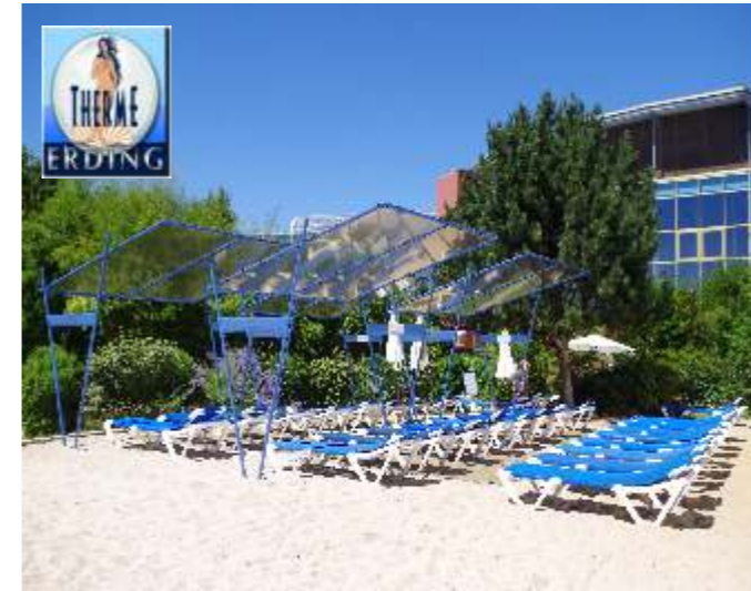
Einzigartiger Sonnenschutz für Ihre Gäste

Die Sonne ist das größte Motiv und der wertbringendste Faktor der Touristikbranche. Sie stellt jedoch auch die größte Belastung als auch Risiko für sonnenhungrige Gäste dar, da sich der Körper anfangs erst auf die erhöhte spontane Belastung einstellen und entsprechend geschützt werden muss.