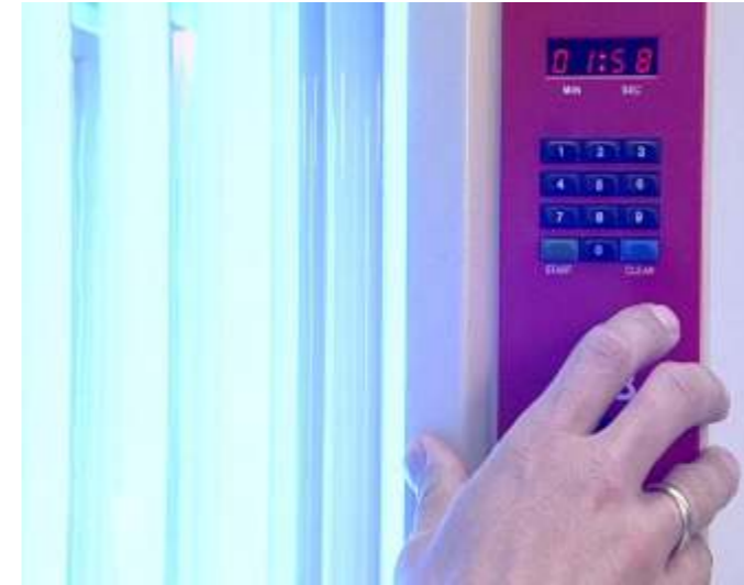
Sanfte Lichtmedizin durch DermalGlas Acryl

Die von führenden Universitätskliniken dermatologisch geprüfte hoch-effiziente Wirkung der HelioVital-Filtertechnologie – welche bereits die hohen Anforderungen für Medizinprodukte erfüllt – ermöglicht erstmals sogar eine gefahrlose humanmedizinische Nutzung des heilenden Lichtes. Es dient für die nebenwirkungsfreie und sanfte Behandlung und Linderung von Hauterkrankungen, chronischen und mentalen Erkrankungen sowie der Stärkung des Immunsystems und Bildung von Vitamin D.