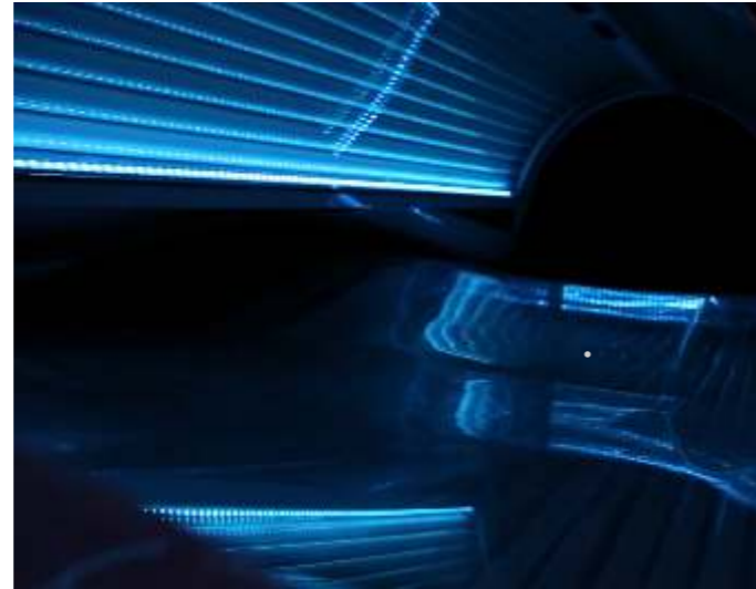
A first: For the first time to be able attain a safe tan in a solarium

In solarium equipment, it is usual to fit panes which are totally penetrable for a broad UV-light-spectrum. This is necessary in order to achieve a browning of the skin through the light tubes. Unfortunately, damaging rays also reach the skin, the negative effects of which are today sufficiently known.