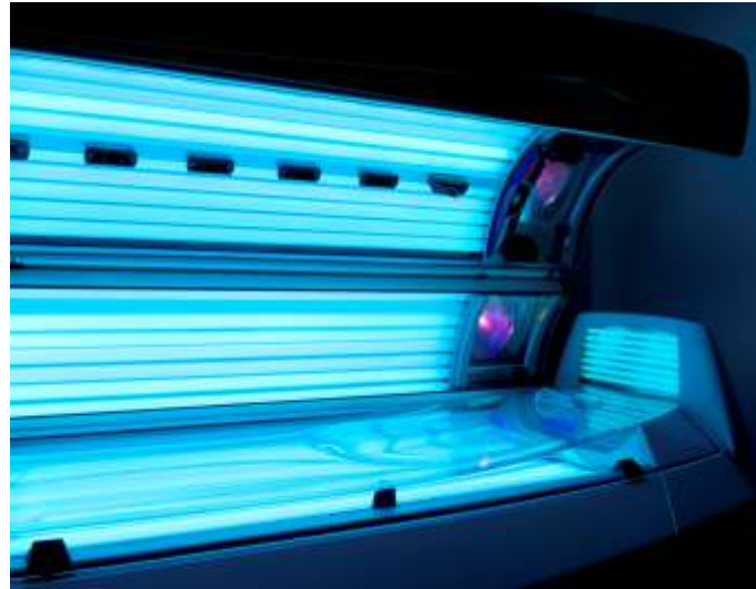
Das Novum: In Solarien erstmals unschädliche Bräune erwerben

Üblicherweise werden in Solariengeräte Scheiben eingebaut, die für ein breites Licht-UV-Spektrum voll durchlässig sind. Dies ist notwendig, um ein Bräunen der Haut durch die Strahlung der Lichtröhren zu ermöglichen. Leider gelangen damit auch schädliche Strahlungsanteile auf die Haut, deren negative Wirkungen gerade im Solarienbereich inzwischen hinlänglich bekannt sind.