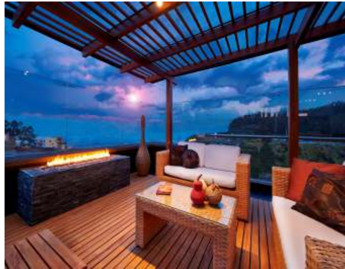
Der ersehnte sonnige Ruhebereich mit Durchblick

DermaGlas Acryl ist der ideale Schutz vor Wind, Wetter und Lärm. Gerade in urbaner Umgebung möchte man Möglichkeiten nutzen, draußen zu sein und bei angenehmen Wetter die Sonne und vor allem Ruhe zu genießen.