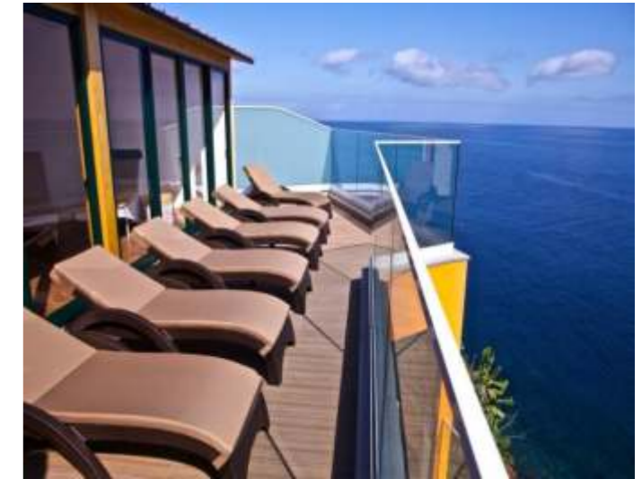
Unique Sun Screening for your guests

Darüber hinaus erhalten Sie die Qualität ihres Poolwassers durch geringere Verunreinigungen von Sonnencremes, welche nach neusten Erkenntnissen nicht nur die Umwelt und Material, sondern auch die Gesundheit Ihrer Gäste nachhaltig schädigen können. Das Sonnenlicht entfaltet hohe biopositive Wirksamkeiten über das ganze Spektrum. Besonders wertvoll sind jedoch die Wellenlängen, die für die wertvolle Vitamin-D3-Bildung und attraktive Hautbräunung relevant sind.