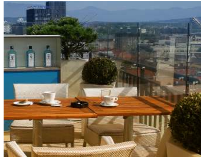
The desired sunny, quiet, relaxing area with a view

Echter Luxus und verbesserte Lebensqualität bietet eine weitere besondere Eigenschaft von DermaGlas Acryl durch seine hohen Schalldämmwerte. Mit z.B. 28 dB Lärmreduktion bei einer 10mm starken Scheibe ist es deutlich besser als übliche Verglasungsmaterialien.